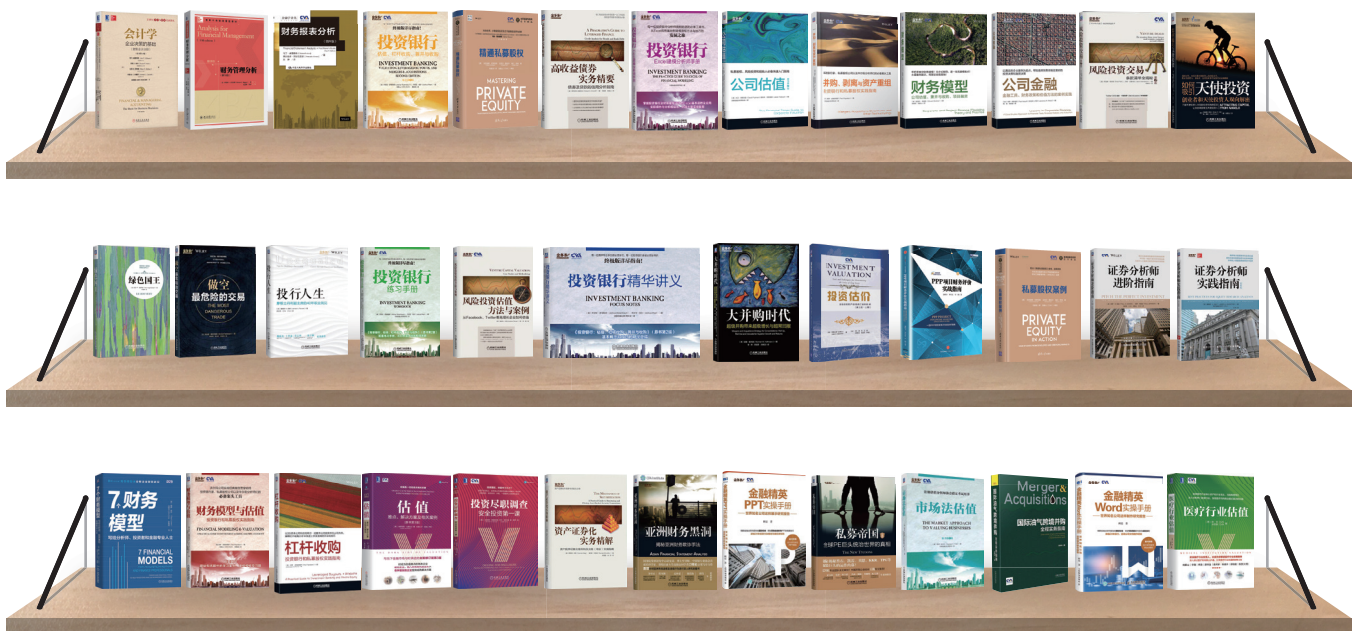
CVA协会出版书籍展示